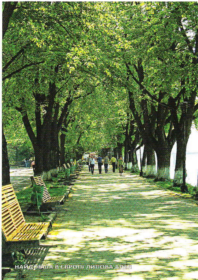
НАЙДОВША В ЄВРОПІ ЛИПОВА АЛЕЯ

У мальовничій місцевості, на околиці села Нижнє Солотвино, розташований комфортабельний санаторій. В основі лікування лежить місцева цілюща термальна або ключова вода, багата мінеральними солями. Неподалік села Новоселиця працює гірськолижна траса довжиною 1040 метрів та пункт прокату спорядження. А поряд з селом Андріївка є чарівне озеро біля лісу. Тут можна прекрасно провести час та насолодитися красою закарпатської природи.