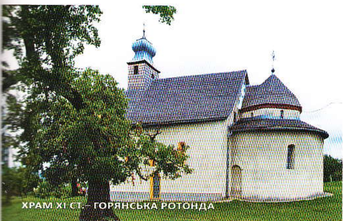
ХРАМ ХІ СТ. — ГОРЯНСЬКА РОТОНДА