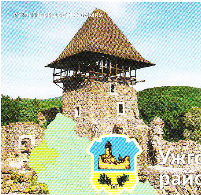
РУЇНИ НЕВИЦЬКОГО ЗАМКУ